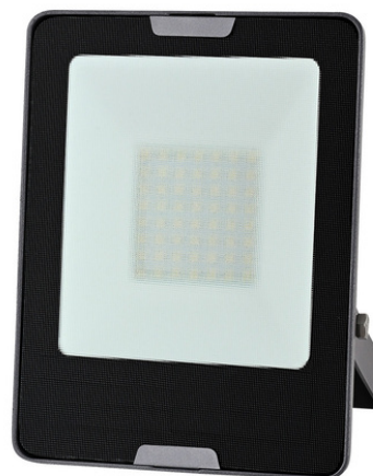
NPI-20 50LQLEDT30MVN 50LQLEDT65MVN